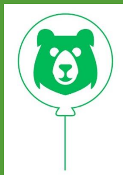
de bonte beren