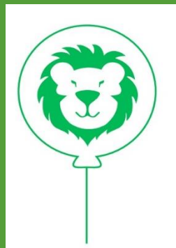
de lachende leeuwen