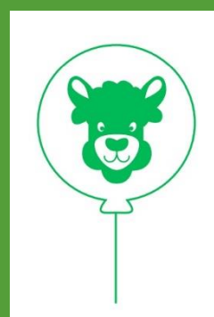
de lollige lama's