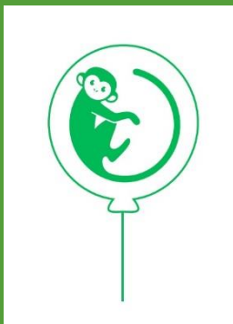
de actieve apen