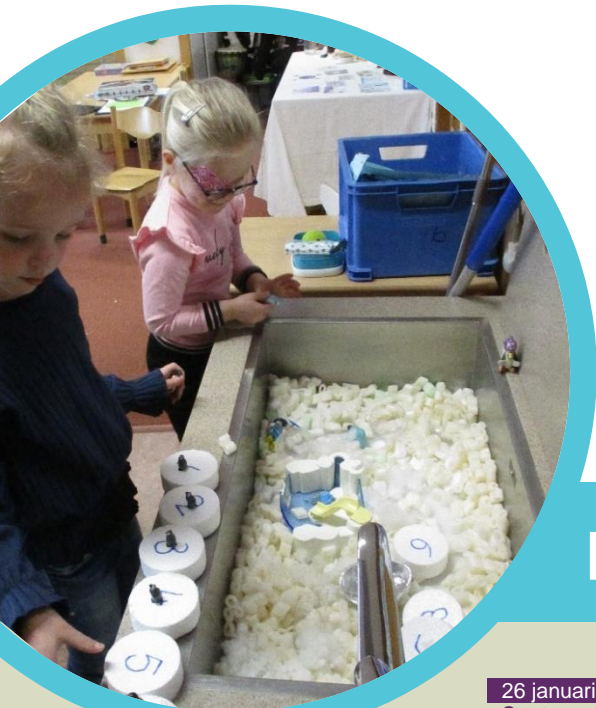
Spelen met 'ijsschotsen' en 'sneeuw' in groep 1a

Via het Ouderportaal volgt dan ook weer meer communicatie omtrent al deze verschillende situaties. We hopen alles zo helder mogelijk te communiceren, maar schroom niet om met de kindcentrumleiders contact op te nemen indien er vragen zijn. En houd ons - via een berichtje aan de leerkracht - op de hoogte van eventuele positieve (zelf)tests! Sterkte en beterschap voor de 'thuiszitters'.