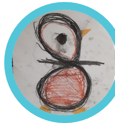
Motoriek: een grote 8 oefenen en er een pinguïn Van maken