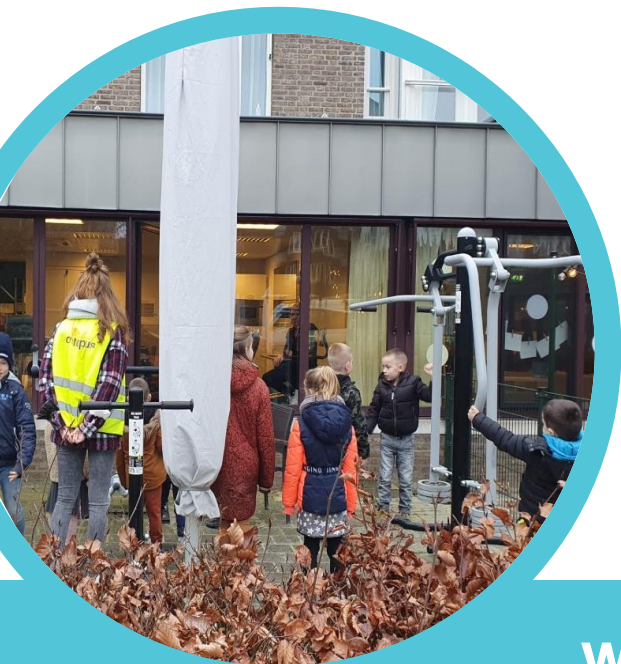
Fitness op straat in de week voor kerst. De kinderen waren er niet weg te krijgen.