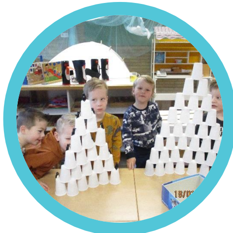
Bouwen zoals iglo's gebouwd worden