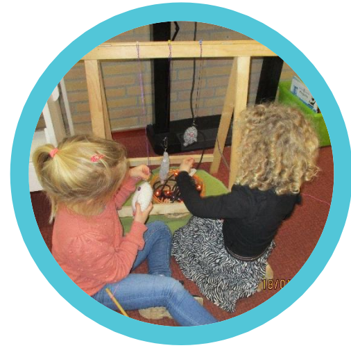
Boven het vuur koken