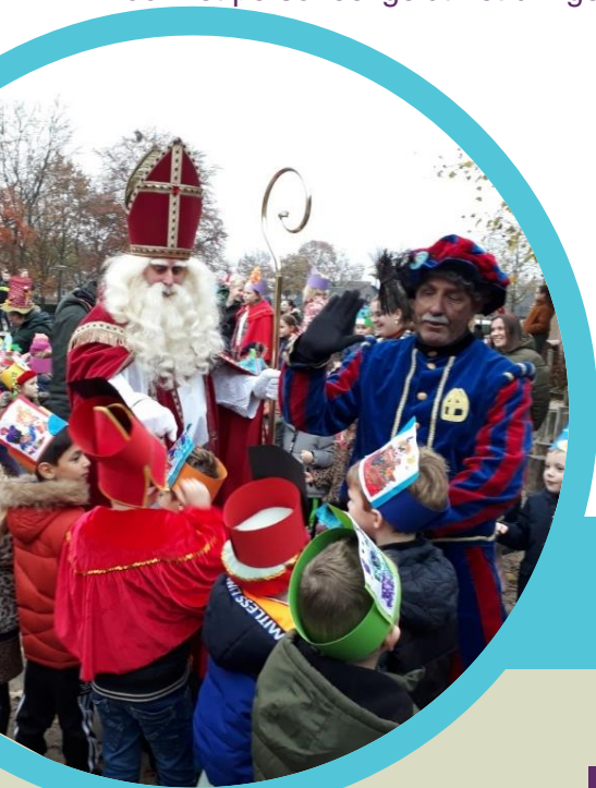
Sint en Pieten hebben gisteren de school bezocht